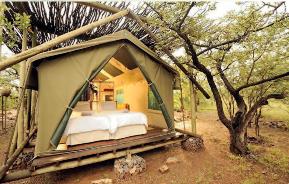
Naturnahe Unterkünfte. Hier: Etosha Village

KALAHARI Tage 7/8 Einer der Höhepunkte dieser Reise erwartet Sie im Kgalagadi Transfrontier Park. Am Südrand eines gigantischen Sandbeckens liegt zwischen dem Nossob und Auob River das Rückzugsgebiet einer einzigartigen Tier- und Pflanzenwelt, die sich an die harschen Bedingungen angepasst hat. In den