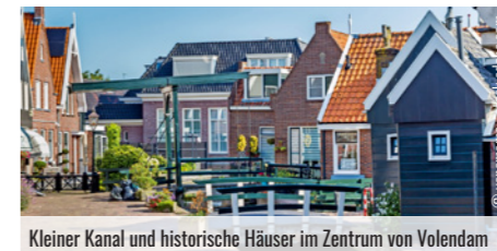
Kleiner Kanal und historische Häuser im Zentrum von Volendam

Genießen Sie das Frühstück im Hotel, bevor wir die Heimreise antreten. Mit Ihrem Rad und vielen neuen, tollen Erinnerungen im Gepäck geht es im 5* Bistro-Bus wieder nach Hause.