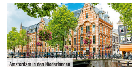
Amsterdam in den Niederlanden

Genießen Sie die historischen Gebäude, herrlichen Museen und die gemütliche Atmosphäre. Bei einer Grachtenrundfahrt können Sie sich von der Einzigartigkeit der Metropole überzeugen. Aufgrund der kurzen Etappe haben Sie Zeit, die schöne Stadt zu erkunden. Abendessen und Übernachtung in Amsterdam.