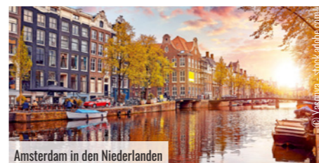
Amsterdam in den Niederlanden