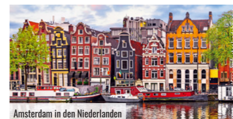
Amsterdam in den Niederlanden