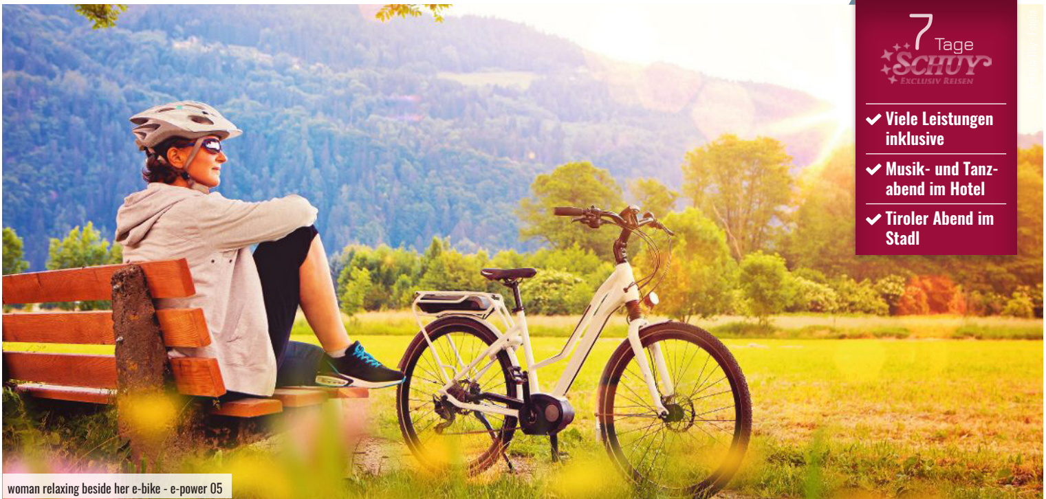
woman relaxing beside her e-bike - e-power 05