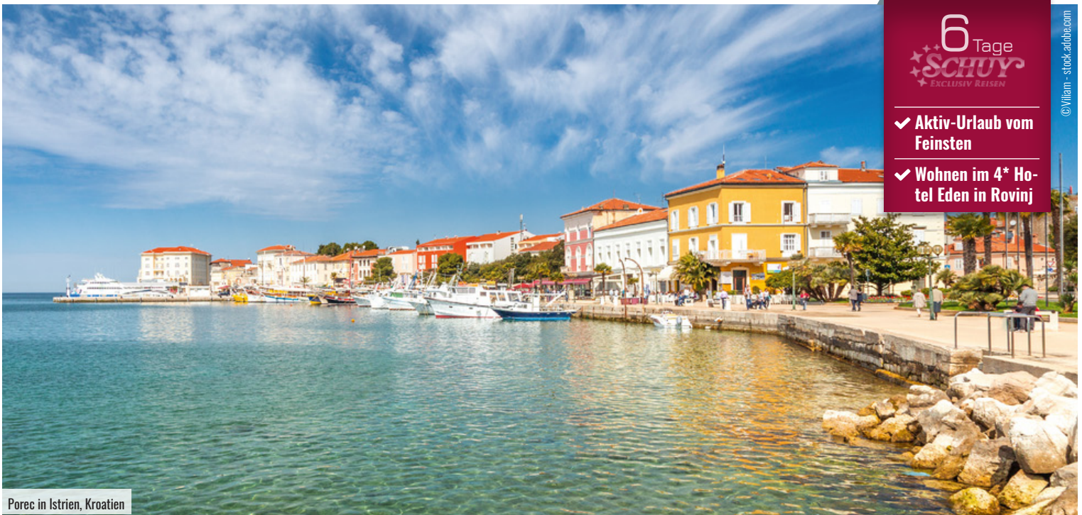
Porec in Istrien, Kroatien