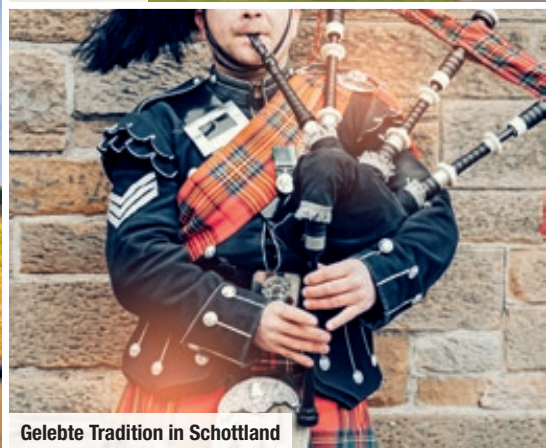
Gelebte Tradition in Schottland