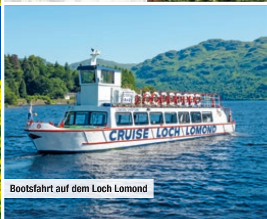
Bootsfahrt auf dem Loch Lomond