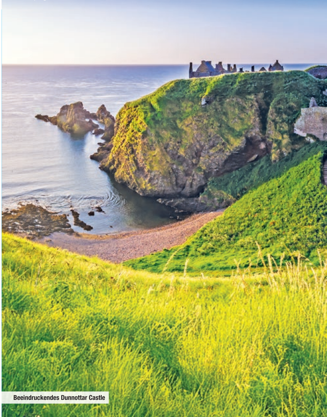
Beeindruckendes Dunnotar Castle