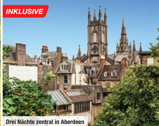
Drei Nächte zentral in Aberdeen