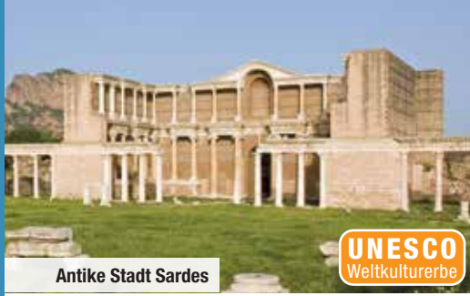
Antike Stadt Sardes