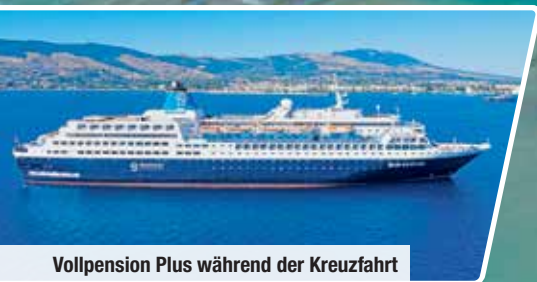
Vollpension Plus während der Kreuzfahrt

Kreuzfahrt mit den Inseln Rhodos, Kos, Samos & Patmos