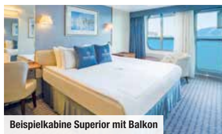
Beispielkabine Superior mit Balkon