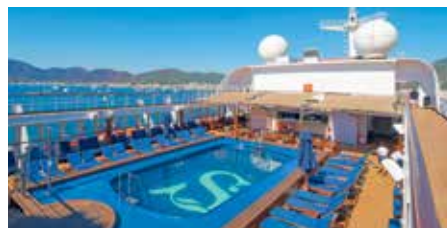
Sonnendeck der MS Blue Sapphire

Die Blue Sapphire bietet Ihnen sehr geräumige Kabinen mit höchstem Komfort. Die Vollpension inkludiert neben den 3 Hauptmahlzeiten alkoholfreie & ausgewählte alkoholische Getränke zu den Mahlzeiten sowie Teezeit & Nachtsuppe.