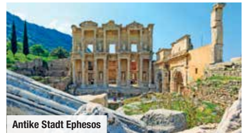
Antike Stadt Ephesos

Superior-Außenkabine mit Balkon Große Kabine (ca. 21 m 2 ) mit Doppelbett und Balkon für fantastische Ausblicke € 349 p.P.